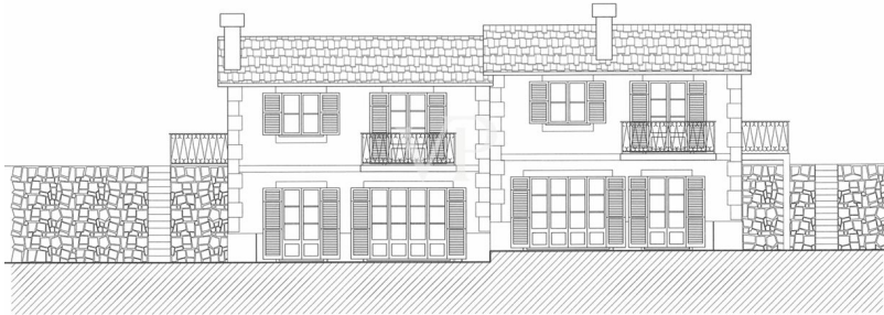
prospetto principale scala 1:100