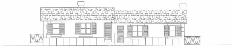
prospetto nord scala 1:100