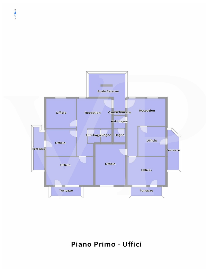
Piano Primo - Uffici