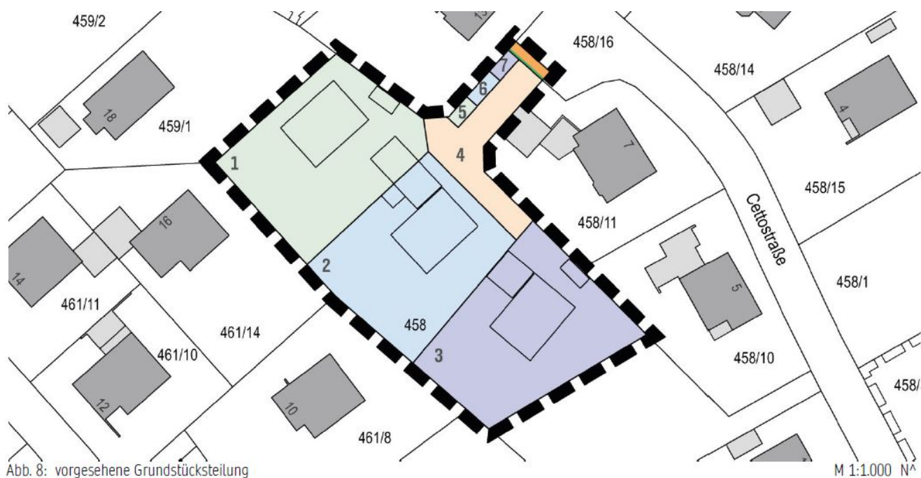
Abb. 8: vorgesehene Grundstücksteilung