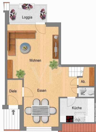
Grundriss Ebene DG