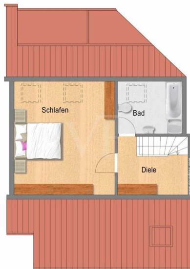
Grundriss Ebene Galerie