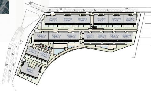
01 SITUACIÓN Y EMPLAZAMIENTO