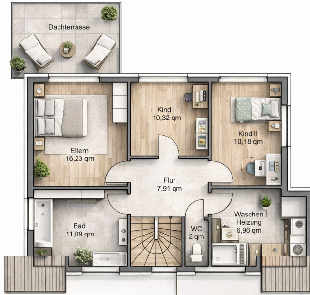
2. Obergeschoss / Dachgeschoss 65,38 qm