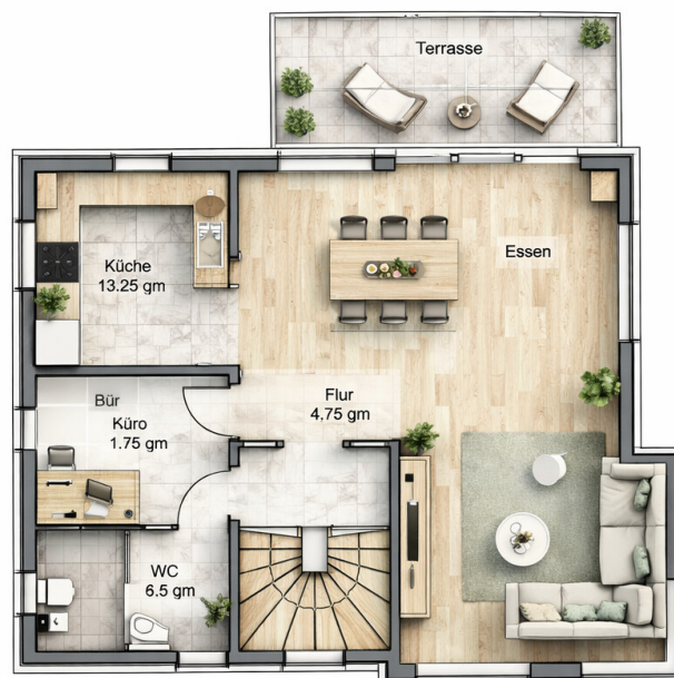
1. Obergeschoss 77,36 qm