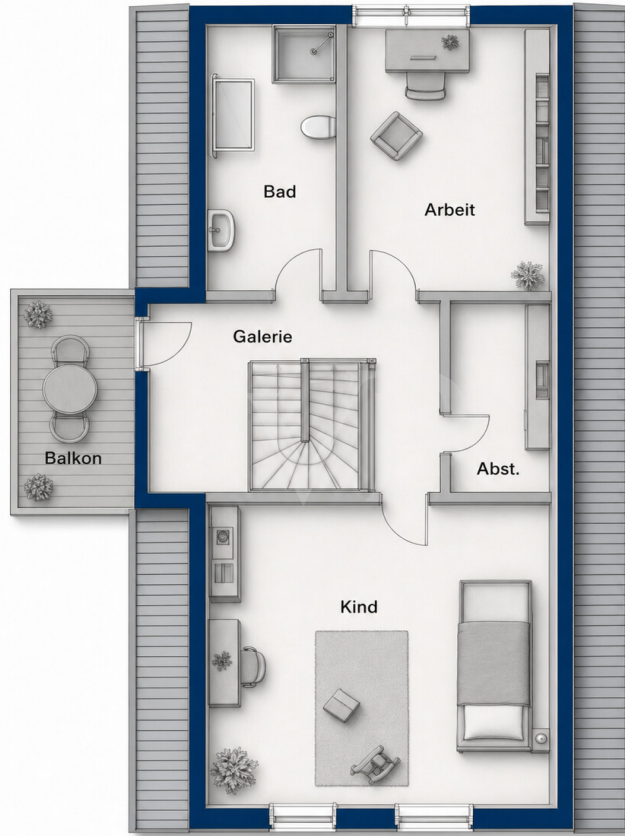
❖ KI-basiertes Bild