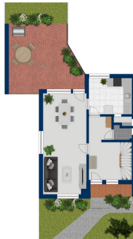
Diagramm nicht maßstabesgetreu

This floor plan is not to scale. The documents were given to us by the client. For this reason, we cannot guarantee the accuracy of the information.