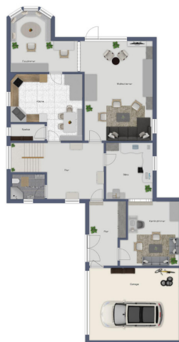
Diagramm des zweiten Stockwerks (1. Obergeschoss)