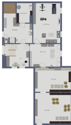
Diagramm des ersten Stockwerks (Erdgeschoss)