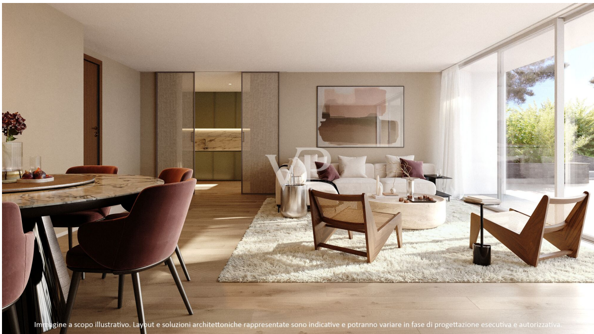
Immagine a scopo illustrativo. Layout e soluzioni architettoniche rappresentate sono indicative e potranno variare in fase di progettazione esecutiva e autorizzativa.