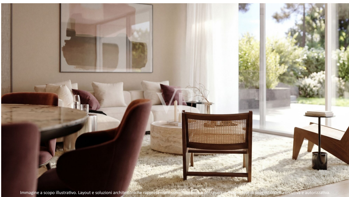
Immagine a scopo illustrativo. Layout e soluzioni architettoniche rappresentate sono indicative e potranno variare in fase di progettazione esecutiva e autorizzativa.