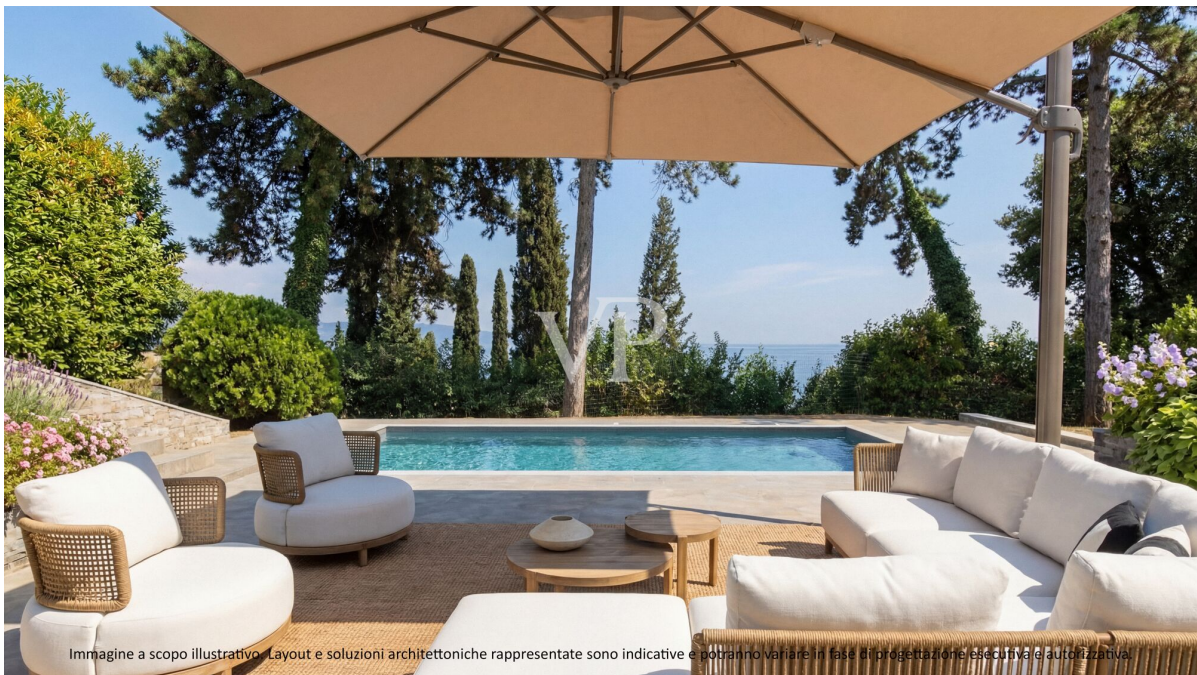
Immagine a scopo illustrativo. Layout e soluzioni architettoniche rappresentate sono indicative e potranno variare in fase di progettazione esecutiva e autorizzativa.