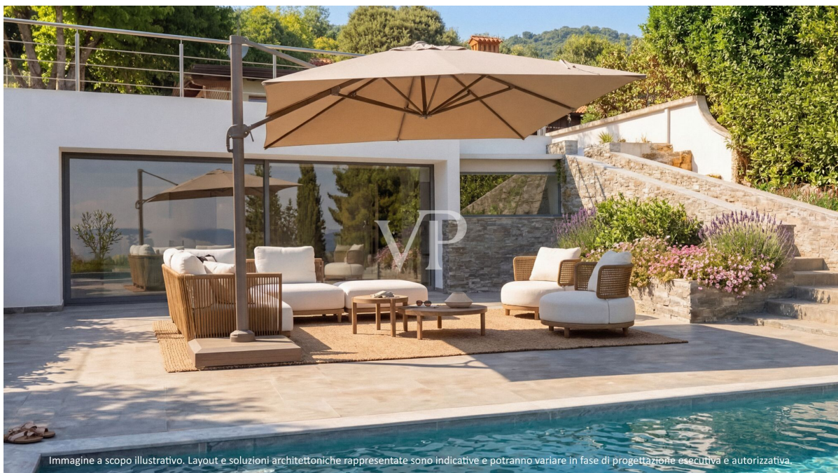
Immagine a scopo illustrativo. Layout e soluzioni architettoniche rappresentate sono indicative e potranno variare in fase di progettazione esecutiva e autorizzativa.