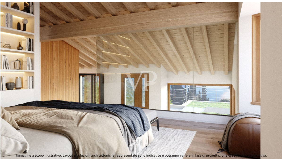
Immagine a scopo illustrativo. Layout e soluzioni architettoniche rappresentate sono indicative e potranno variare in fase di progettazione esecutiva e autorizzativa.