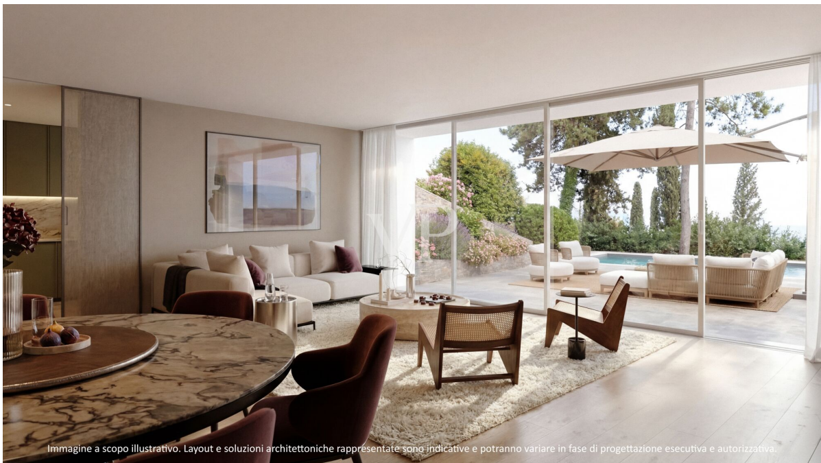
Immagine a scopo illustrativo. Layout e soluzioni architettoniche rappresentate sono indicative e potranno variare in fase di progettazione esecutiva e autorizzativa.