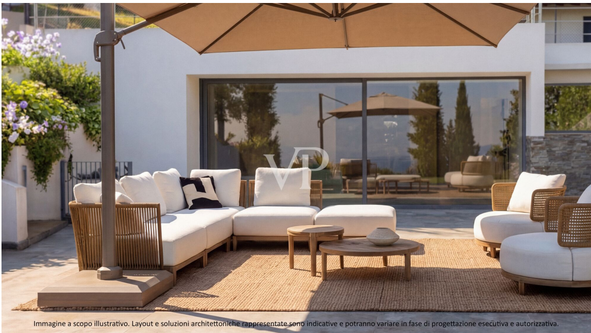
Immagine a scopo illustrativo. Layout e soluzioni architettoniche rappresentate sono indicative e potranno variare in fase di progettazione esecutiva e autorizzativa.