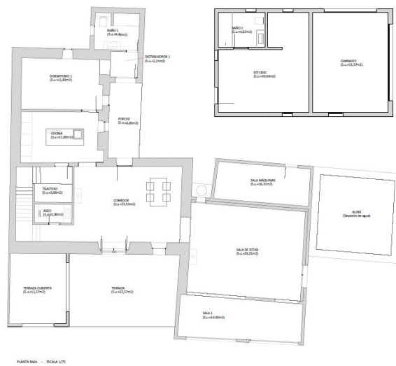
PUNTA SINA - ESCALA UTI