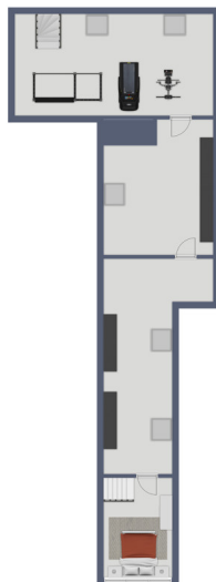
Exposplan, nicht maßstäblich