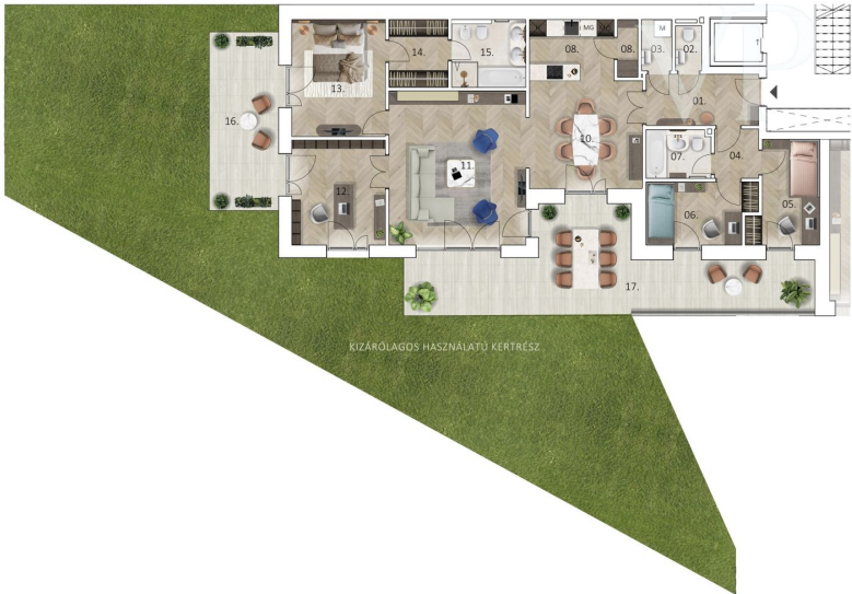
A01 0m 10m 20m 30m 40m 50m