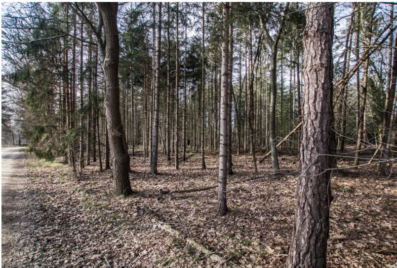
Blick aufs Grundstück