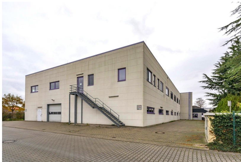
Von Poll - Wesel