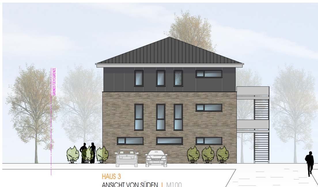
HAUS 3 ANSICHT VON SÜDEN | M100