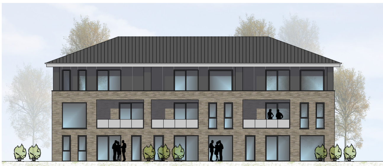
HAUS 3 ANSICHT VON WESTEN | M100