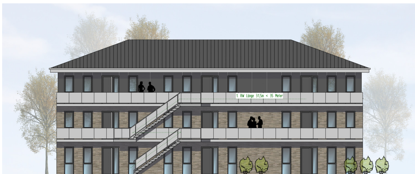
HAUS 3 ANSICHT VON OSTEN | M100