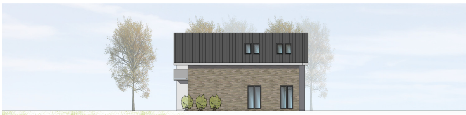
ANSICHT VON SÜDEN | M100