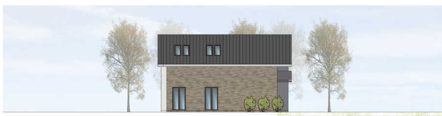
ANSICHT VON NORDEN | M100