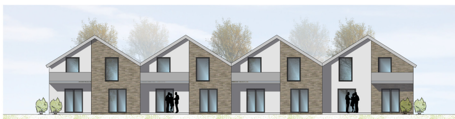
ANSICHT VON WESTEN | M100