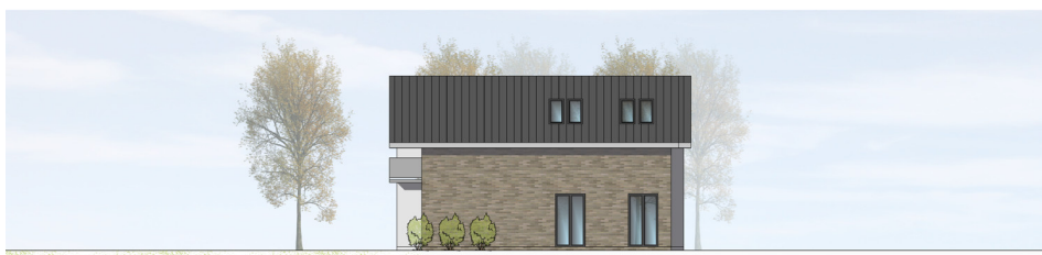
ANSICHT VON SÜDEN | M100