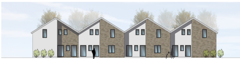
ANSICHT VON OSTEN | M100