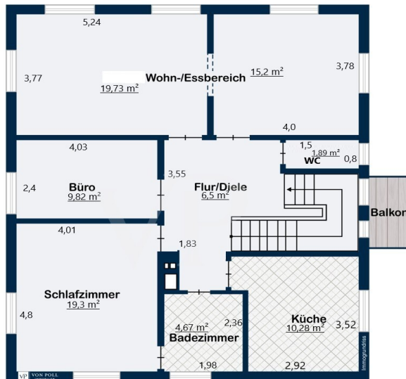
Obergeschoss ca. 87 m 2