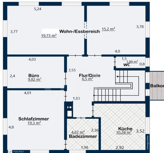
Obergeschoss ca. 87 m 2