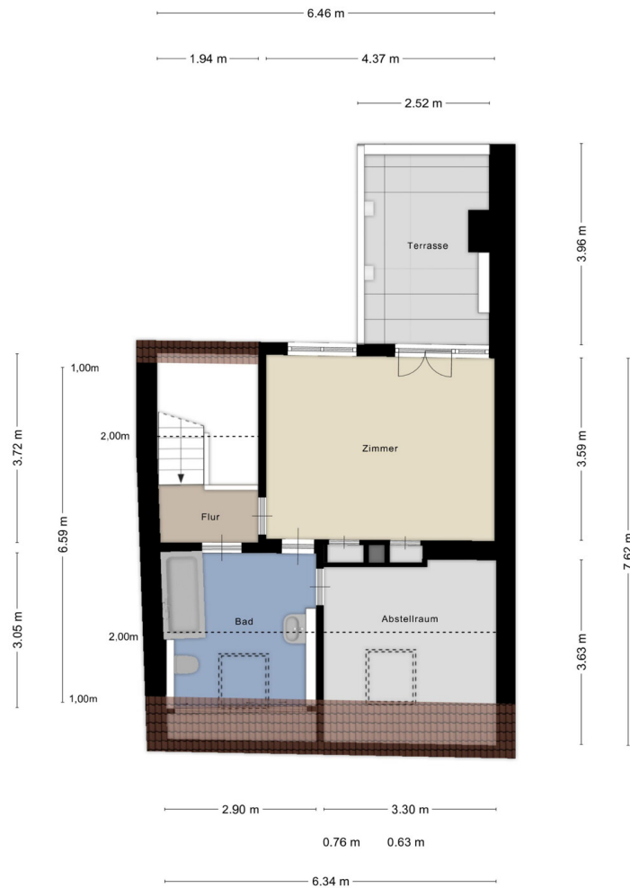
Aufmass und Grundriss erstellt von Zibber ©