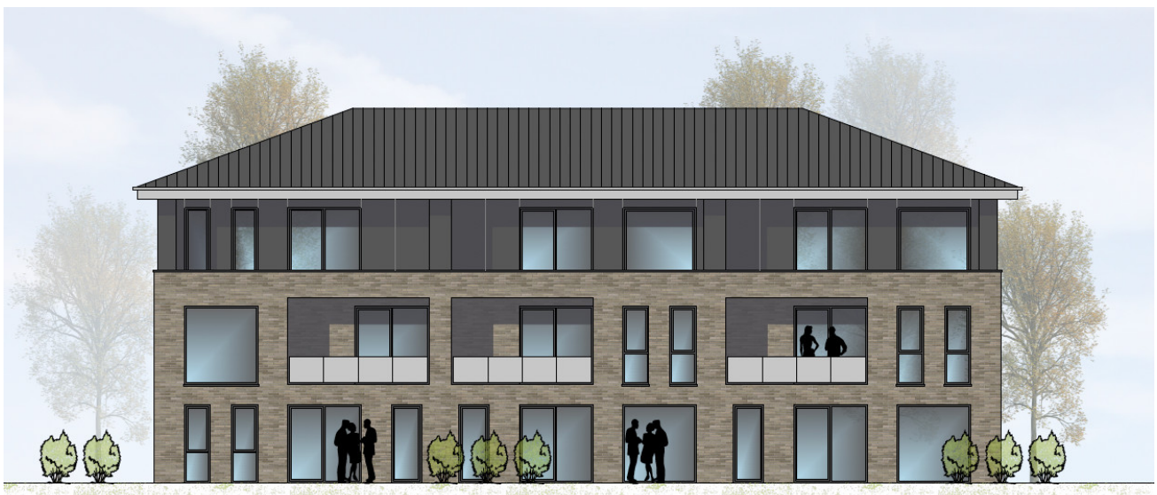
HAUS 3 ANSICHT VON WESTEN | M100