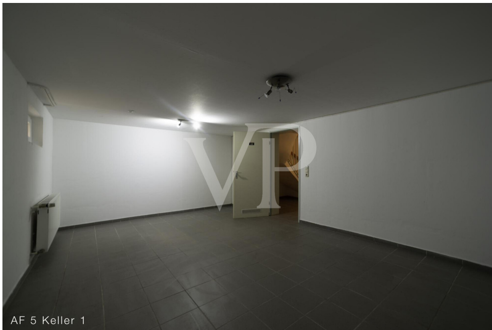
AF 5 Keller 1