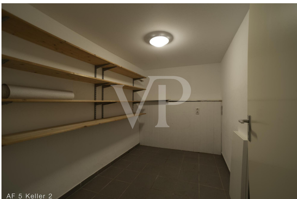
AF 5 Keller 2