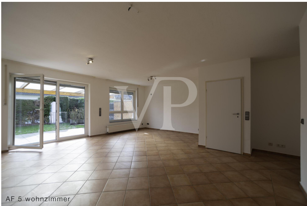
AF 5 wohnzimmer