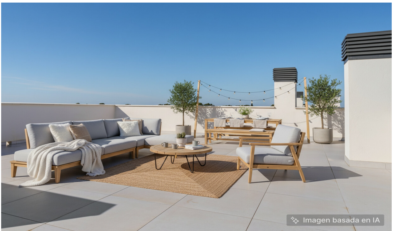
Imagen basada en IA

KAUFPREIS: 768.000 EUR • WOHNFLÄCHE: ca. 94,06 m 2 • ZIMMER: 3