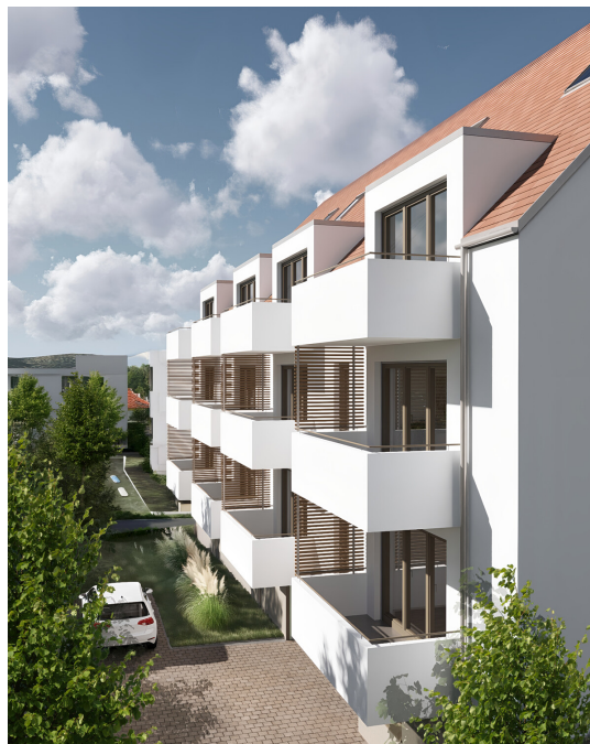
Herrschaftgartenstraße 12 – Leben in Böblingen