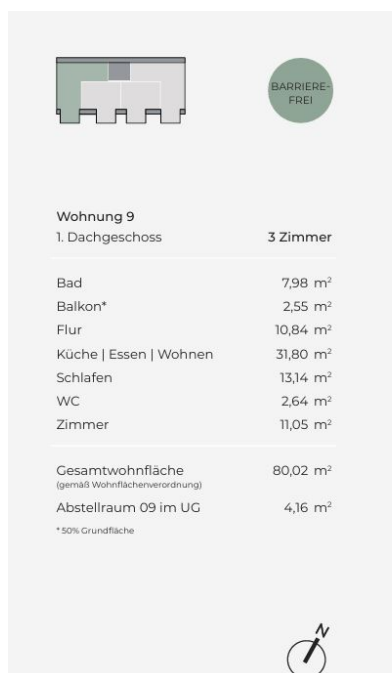
Herrschaftsgartenstraße 12 – Leben in Böblingen