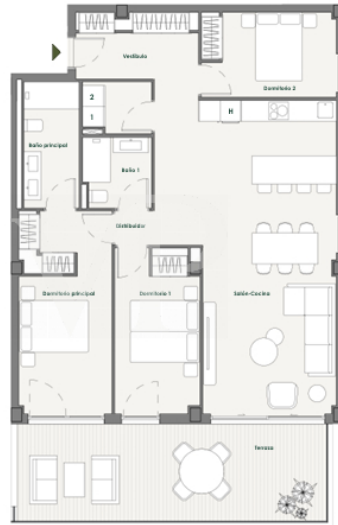
UBICACIÓN DE ELECTRODOMÉSTICOS QUE NO SE SUMISTRAN: